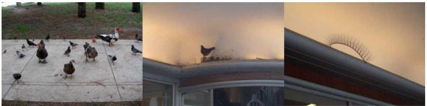
Abb. 1: Ein Beispiel für erwünschte und unerwünschte Stadtauben, mit unsachgemäßer Vergrämung in Houston, Texas, USA

Egal welchen Kontinent man bereist, einige Dinge scheinen immer vertraut. Das Auftreten großer Populationen von Stadtauben in urbanen Bereichen gehört dazu. Scheinbar unabhängig von der geographischen Lage haben die Stadtauben, ihren Platz in unsere direkte Nachbarschaft (Abb. 1).